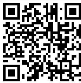
Figura 2. Imagen de código QR para ir a instructivo de estilo de citación de la APA (sexta edición). Se puede conectar con cualquier teléfono inteligente. Caso contrario, ir a este link: http://www.freewebs.com/cepucv/Apa.pdf